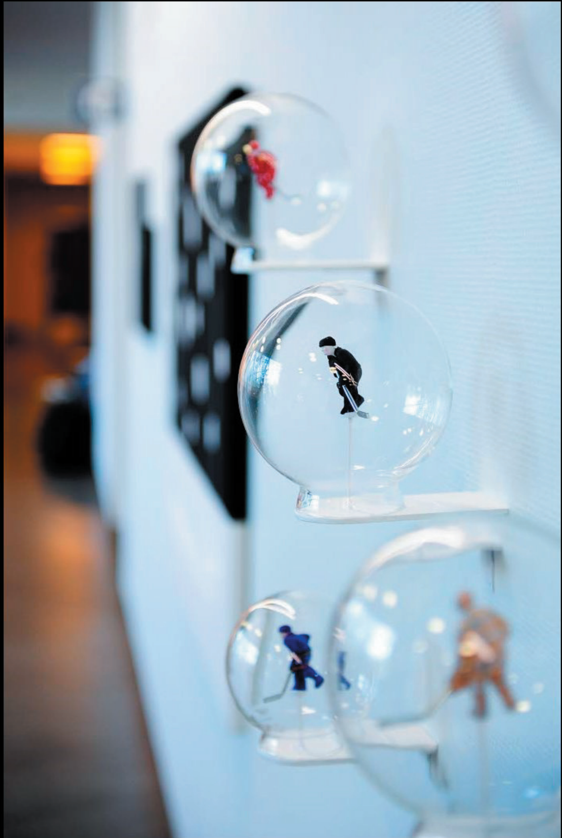
Boys in bubbles